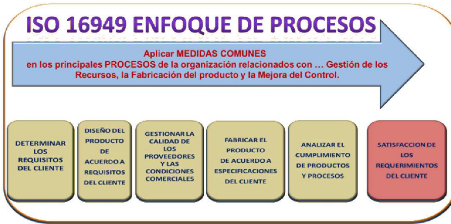
Figura 1.1: Enfoque de calidad en la industria del automóvil

La ingeniería del software amplía la visión del desarrollo del software como una actividad esencialmente de programación, contemplando además otras actividades de análisis y diseño previos, y de integración y verificación posteriores. La distribución de todas estas actividades a lo largo del tiempo constituye lo que se ha dado en llamar ciclo de vida del desarrollo de software.