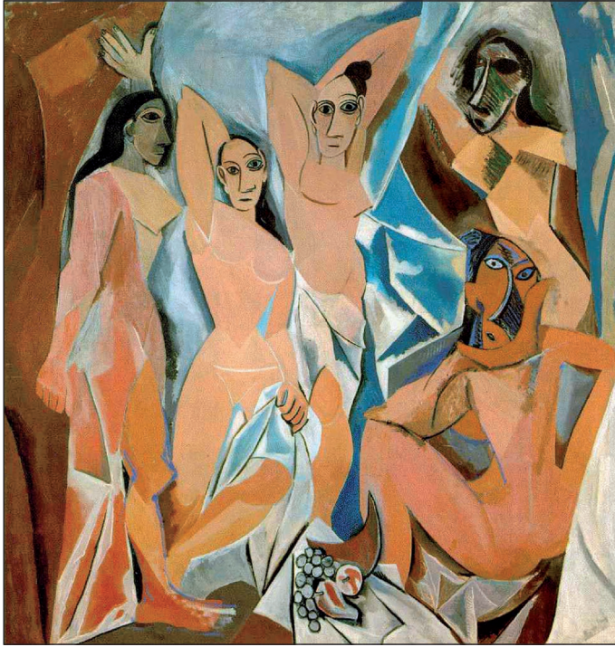
Figura. 2. Pablo Picasso, Las señoritas de Avignon . 1907. Nueva York, Museum of Modern Art.